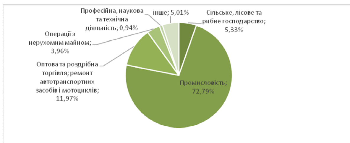
Рис. 2. Розподіл прибутку підприємств за видами економічної діяльності у 2017 році (складено автором за даними [1])

Видами економічної діяльності, в яких підприємства отримали найбільші частки прибутків у 2017 році, є промисловість, оптова торгівля та сільське господарство.