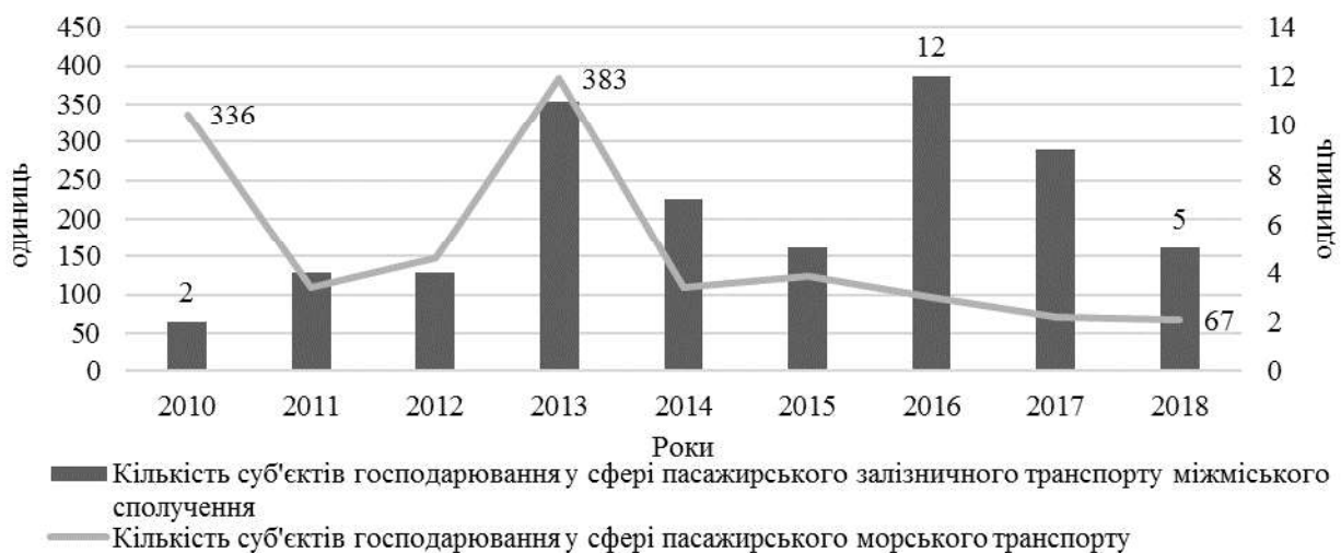
Рис. 1. Динаміка кількості суб'єктів господарювання у сфері пасажирського залізничного транспорту міжміського сполучення та морського

Відповідно до рис. 2 можна відзначити, що починаючи з 2013 року кількість КЗР різко знизилась, такий стан можливо пояснити, порівнюючи його з показником кількості підприємств готельного типу. Так, відбулась часткова міграція та зміна у структурі КЗР, частина яких переорієнтувала свій бізнес у готельний. Також низка КЗР не виправдала власних очікувань стрімкого зростання після Євро 2012 та покинула ринок туристичних послуг.