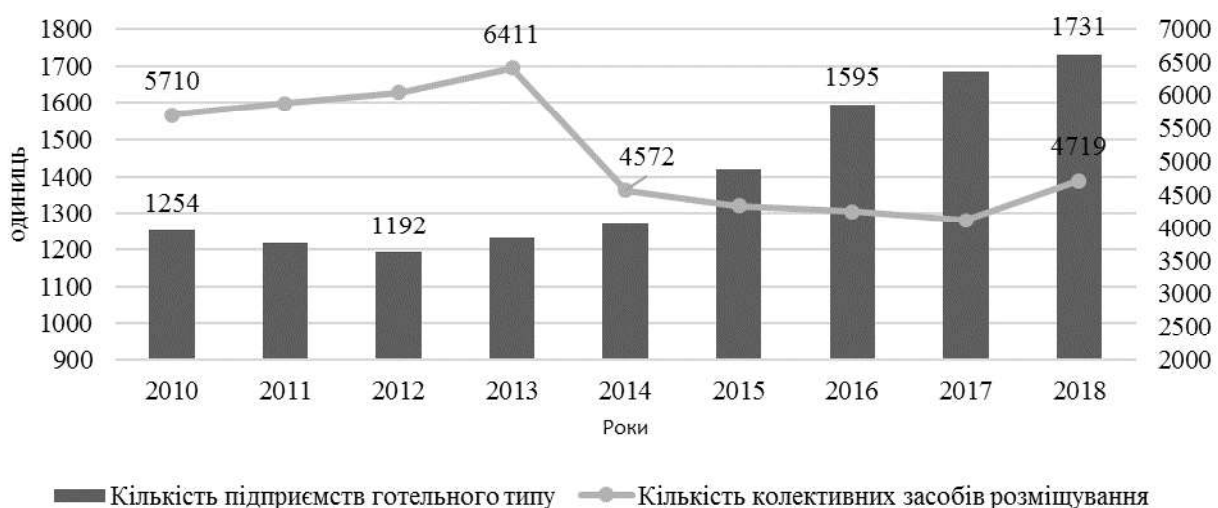
Рис. 2. Динаміка кількості підприємств готельного типу та КЗР

Відповідно до рис. 2 можна відзначити, що починаючи з 2013 року кількість КЗР різко знизилась, такий стан можливо пояснити, порівнюючи його з показником кількості підприємств готельного типу. Так, відбулась часткова міграція та зміна у структурі КЗР, частина яких переорієнтувала свій бізнес у готельний. Також низка КЗР не виправдала власних очікувань стрімкого зростання після Євро 2012 та покинула ринок туристичних послуг.