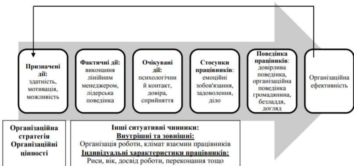
Рис. 2. Модель «управління персоналом та організаційна ефективність» [3, с. 21]

В моделі можна спостерігати як причинно-наслідковий так і зворотній зв'язок, тому вона може бути використана в управлінні, бо розкриває зв'язок між ефективністю деяких працівників та ефективністю всієї організації.