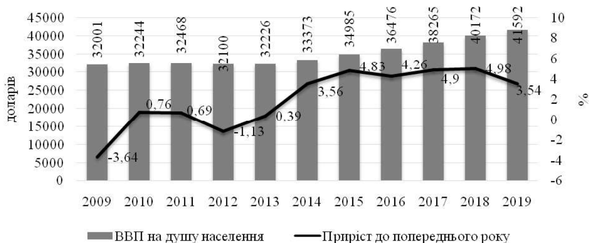
Рис. 1. Динаміка ВВП на душу населення Іспанії (в поточних цінах, ПКС) у 2008-2019 рр. (складено автором на основі [1])

Економіка Іспанії за останні десять років пережила значні зміни: з країни «другого ешелону» вона перетворилася в країну з високим рівнем життя, соціальної захищеності та з прогресивною технологією. Процес глобалізації останніх років позитивно вплинув на іспанську економіку. Сьогодні економіка Іспанії – експортно-орієнтована, високотехнологічна, інтернаціоналізована та конкурентоспроможна. Насамперед, це переконання відображує показник ВВП країни. Іспанія – одна з лідуєчих країн Європи за показником ВВП. Цей показник невинно зростає: за даними Національного інституту статистики в 2017 році ВВП виріс на 3,1% в порівнянні з минулим роком, що становить 1,3 трильйонів дол. США, а в 2019 році зріс до 1,426 трильйонів дол. США [1]. ВВП Іспанії в розрахунку на душу населення за ПКС представлено на рис. 1.