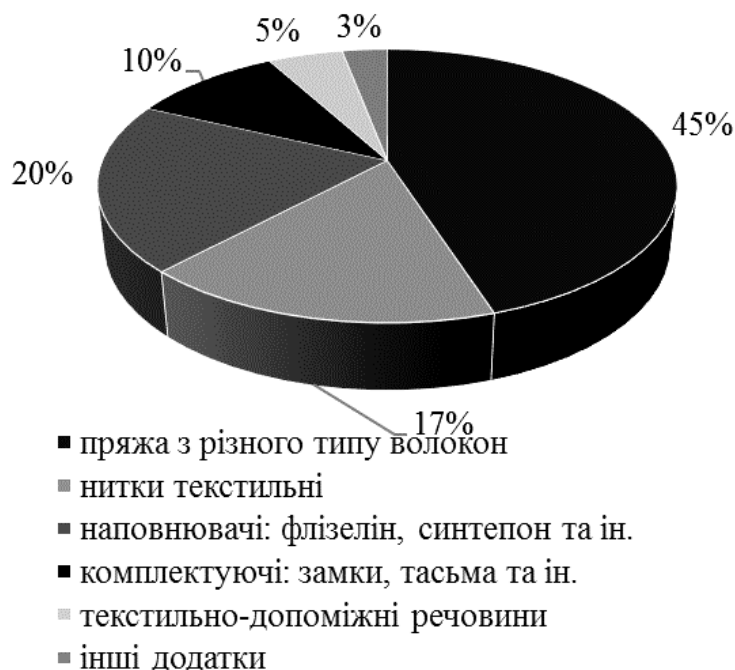
Рис. 3. Структура матеріальних витрат ДП «Датський Текстиль» за 2017–2019 рр.

17 % – різного складу ниток (рис. 3). Слід зазначити, що така структура матеріальних витрат з коливаннями \pm 5\% спостерігається протягом усього періоду дослідження.