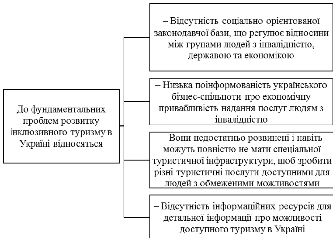
Рис. 1. Фундаментальні проблеми розвитку інклюзивного туризму в Україні [1]

має тримовний напис із перекладом шрифтом Брайля. Подібні скульптури нині встановлено в Черкасах, Львові, Києві та Харкові [2].