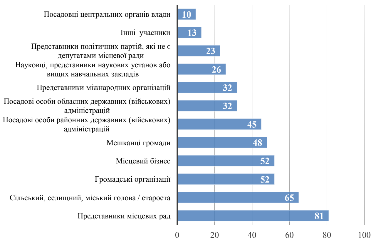
Рис. 2. Залучення представників суспільства до розробки стратегічних планів відновлення громад станом на червень 2023 р., % від громад, що розробили

Опитування керівників громад, проведене у рамках дослідження [8], показало, що лише третина громад має певну стратегію відновлення. Навіть ті, хто має такі документи, вказують, що вони ще не завершені. У процесі розробки планів відновлення громад часто беруть участь представники місцевих рад, і приблизно у половині випадків до процесу залучаються представники громадянського суспільства та бізнесу (рис. 2).