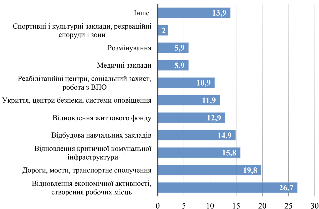
Рис. 3. Пріоритети місцевого самоврядування в проектах відновлення громад станом на червень 2023 р., % від опитаних громад

портне сполучення (19,8%); відновлення критичної комунальної інфраструктури (15,8%); відбудова навчальних закладів (14,9%); та відновлення житлового фонду (12,9%), відбудова медичних закладів (5,9%).