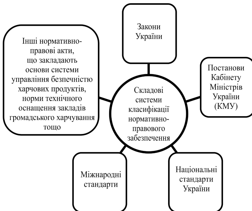
Рис. 1. Складові системи класифікації нормативно-правового забезпечення

Проблемні аспекти аналізу нормативно-правового регулювання діяльності підприємств готельно-ресторанного бізнесу й туризму висвітлені у працях відомих вітчизняних вчених, зокрема Н. Бакерника, М. Бойко, Л. Гопкало, А. Колесніченка, М. Мальської, систематизовано Л. Гончар, А Біляком [1]. Так науковці виділяють такі складові означеної системи класифікації нормативно-правового забезпечення щодо діяльності підприємств готельно-ресторанного і туристичного бізнесу (рис. 1), а саме [1-3].