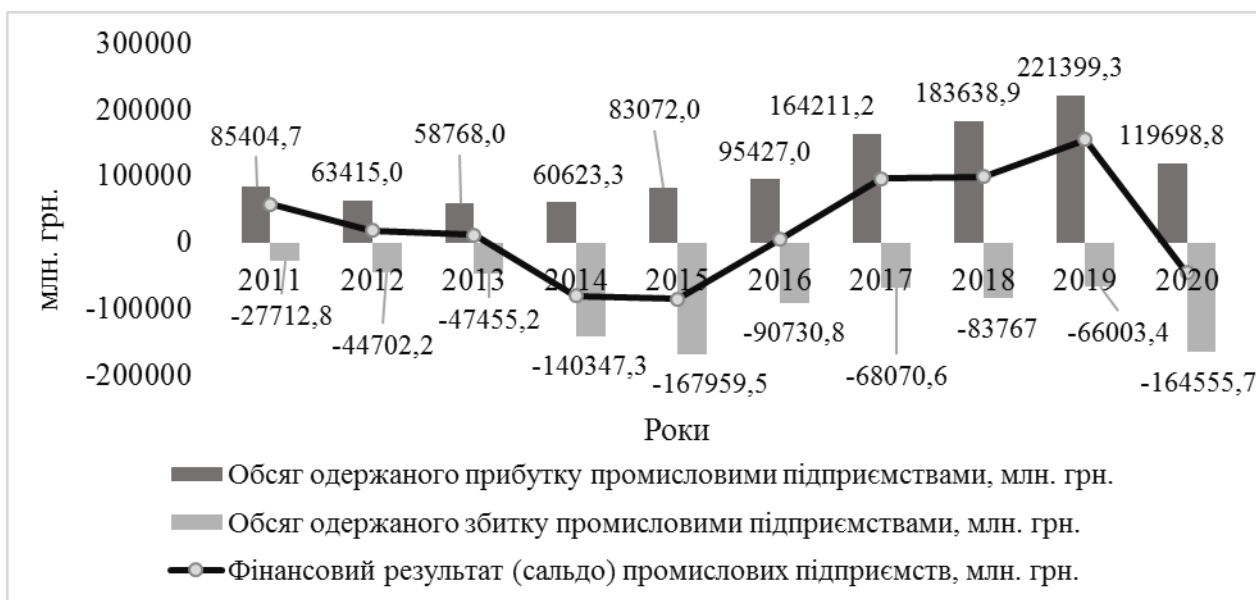
Рис. 1. Динаміка показників фінансових результатів до оподаткування промислових підприємств України за січень-вересень 2011-2020 рр.

На сьогоднішній день, проблема функціонування в умовах змін економічної системи є поширеним явищем, оскільки найбільшого удару за останні десять років зазнають підприємства промислової галузі (рис.1).