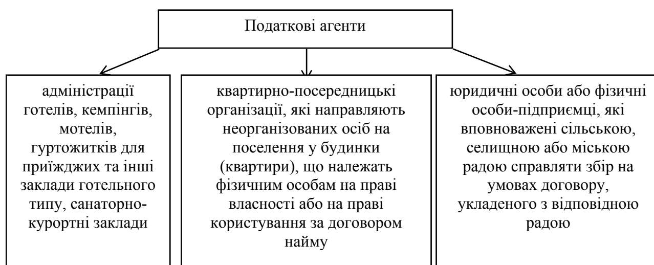
Рис. 2. Різновиди податкових агентів з туристичного збору

Податковими агентами з туристичного збору можуть бути (рис. 2).