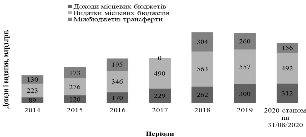
Рис. 1. Динаміка доходів і видатків місцевих бюджетів України за 2014-2020 роки, млрд.грн.

За допомогою даних сайту Децентралізація [1-3] та статистичних даних сайту Ціна держави [4-6], було проаналізовано фінансові результати місцевих бюджетів на державному рівні, визначивши їх частку у Зведеному бюджеті України та у ВВП, і на місцевому, визначивши їх структуру доходів, видатків (рис. 1) та державну фінансову підтримку, в умовах реформи децентралізації.