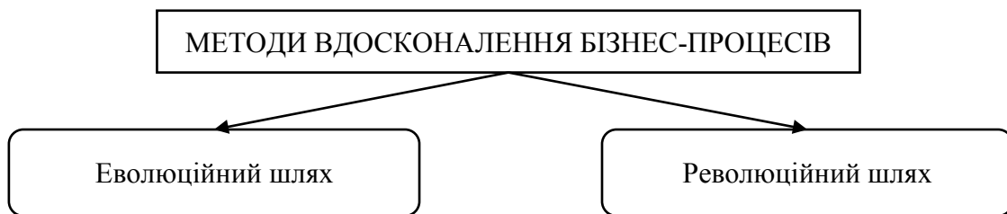
Рис. 2. Методи вдосконалення бізнес-процесів