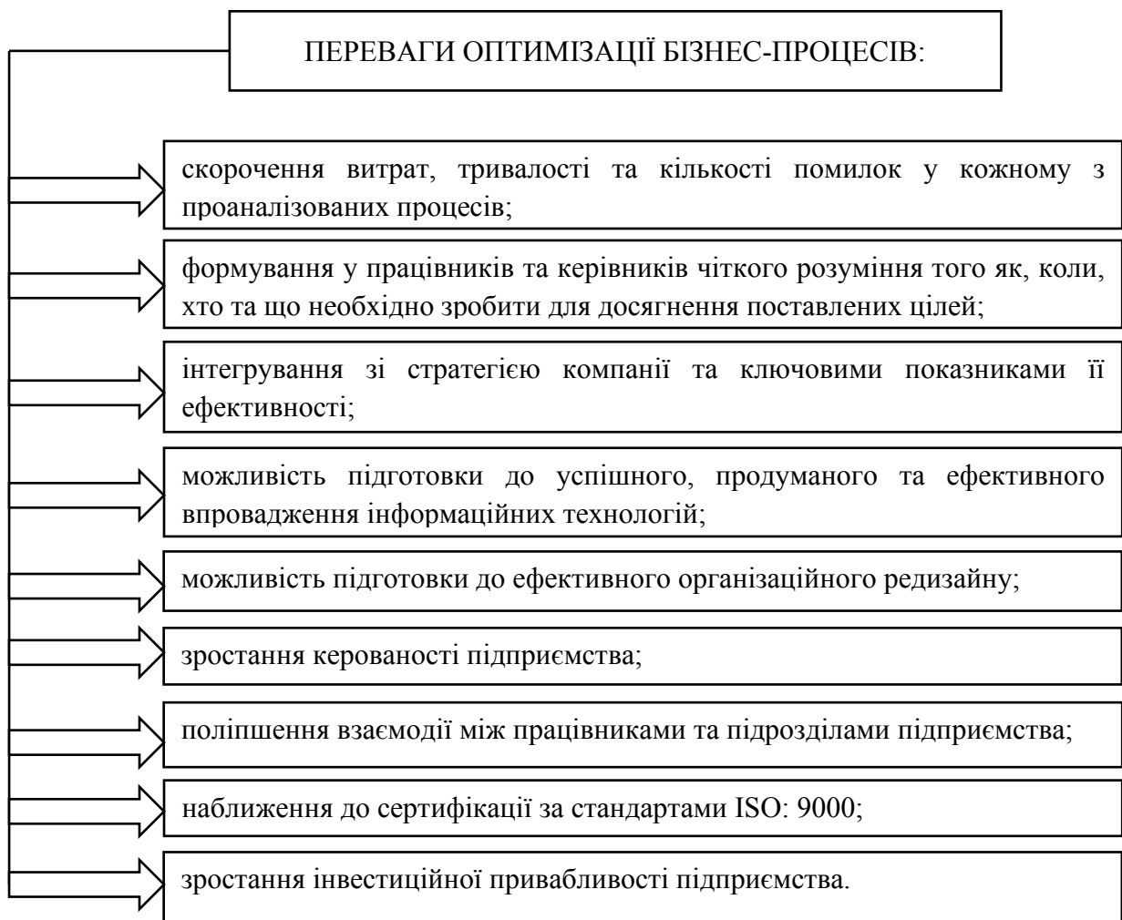
Рис. 3. Основні переваги оптимізації бізнес-процесів

Отже, у сучасних умовах оптимізація бізнес-процесів підприємств забезпечує ефективну роботу компанії, стимулює покращенню якості продуктів або послуг, а також сприяє зростанню продуктивності, зниженню витрат і, звичайно, збільшенню прибутку.