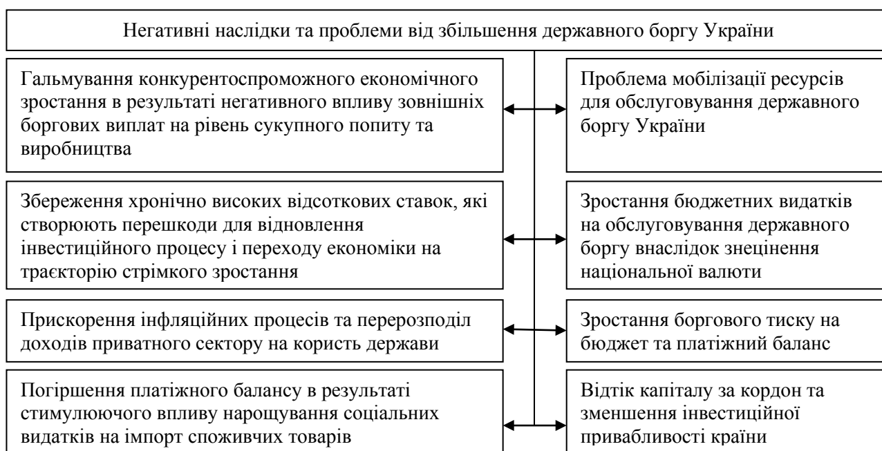
Рис. 2. Наслідки та проблеми збільшення державного боргу України