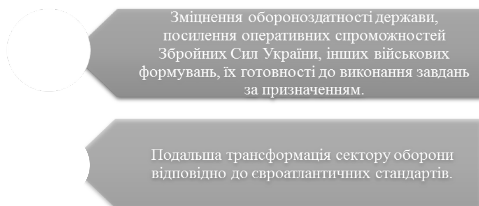
Рис. 1. Ключові завдання оборонного співробітництва між Україною та НАТО

Сучасний етап розвитку соціально-економічних відносин характеризується необхідністю посилення співпраці України та міжнародних організацій. Так, у 1991 р. зі здобуттям незалежності Україна почала брати активну участь та співпрацювати з ними. Особливої важливості наразі набуває співробітництво з НАТО (Північноатлантичним Альянсом). Відтак, серед країн СНД Україна першою приєдналася до Програми «Партнерство заради миру» після підписання відповідного рамкового документу 8 лютого 1994 р. [1]. На сьогоднішній день тенденції співробітництва між Україною та НАТО визначаються такими основними документами, як: Хартія про особливе партнерство між Україною та Організацією Північноатлантичного договору, що підписана під час Мадридського саміту Альянсу 9 липня 1997 р., та Декларація про доповнення Хартії про особливе партнерство, схвалена у серпні 2009-го в Брюсселі, з урахуванням результатів Бухарестського саміту [2]. У межах саміту, країнами-членами Альянсу були прийняті основні завдання щодо реформування та змін в оборонній галузі України, які спрямовані на посилення власної військової безпеки, а також підвищення співпраці між Збройними Силами України та силами НАТО (рис. 1).